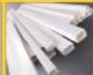
19 типоразмеров, в т. ч. с внутренней перегородкой