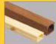
Матовая глянцевая ламинация