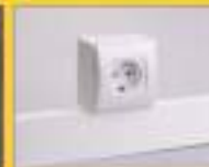
Интеграция с электроустановкой