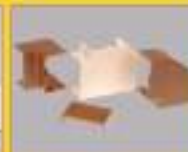
Полный ассортимент аксессуаров