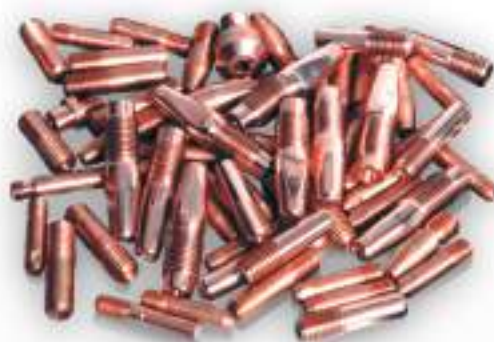
НАКОНЕЧНИКИ ИЗ ДИСПЕРСНО-УПРОЧНЕННОГО КОМПОЗИЦИОННОГО МАТЕРИАЛА

624091, Свердловская обл. г. Верхняя Пышма, ул. Ленина, 1 Телефон: +7 (34368) 9-81-23, 9-81-28