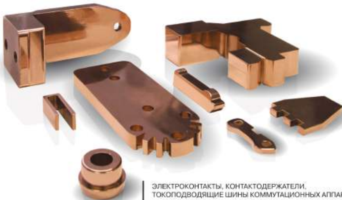
ЭЛЕКТРОКОНТАКТЫ, КОНТАКТОДЕРЖАТЕЛИ, ТОКОПРОВОДЯЩИЕ ШИНЫ КОММУТАЦИОННЫХ АППАРАТОВ; КОЛЛЕКТОРНЫЕ ПЛАСТИНЫ, ЛАМЕЛИ